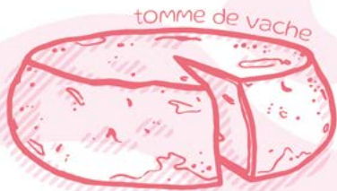
tomme de vache