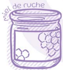
miel de ruche