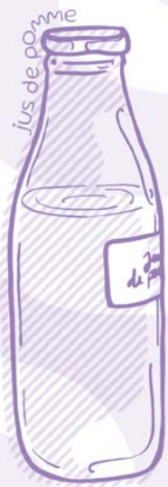
jus de pomme