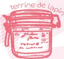
terrine de lapin