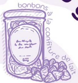
bonbons à la confiture de lait