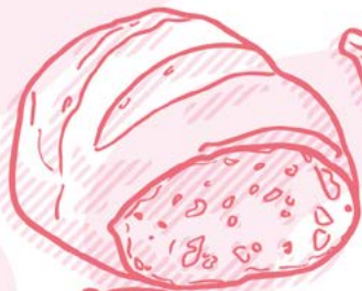
pain au levain