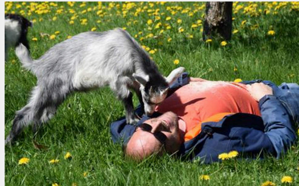
Les bénéfices pour les accueilli-es